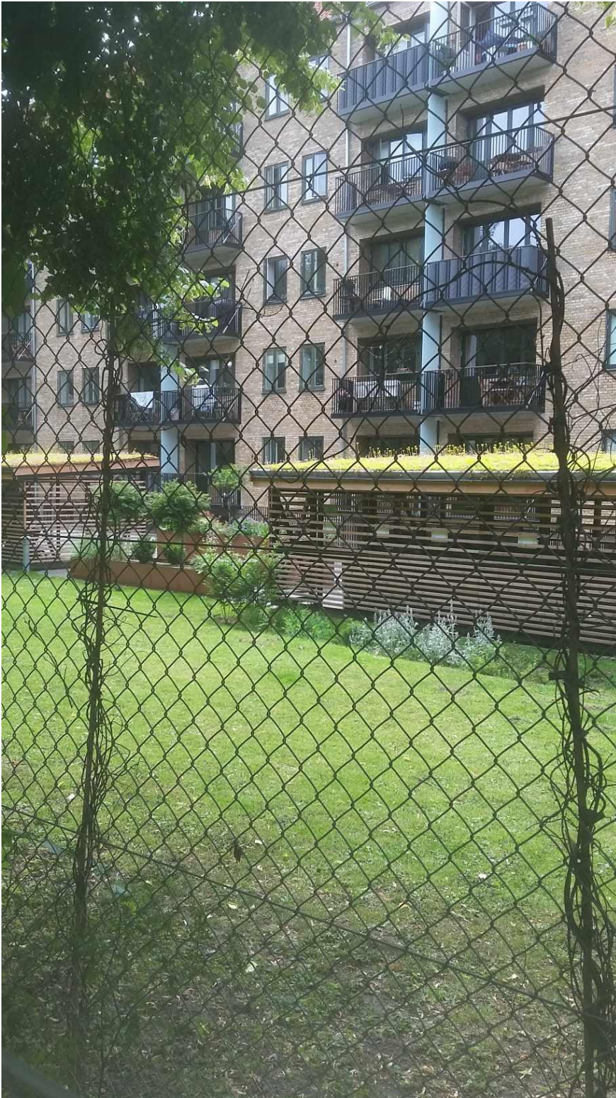
Gård på Ane Katrines Vej (bagsiden af den lange ejendom ud mod Bispebuen)

Her er nogle fotos af lokale gårdanlæg, der kan evt. kan tjene som inspiration.